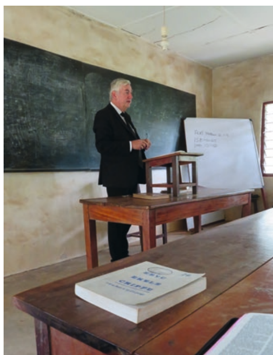
3. Ik mocht iets vertellen over de geschiedenis van de school - en mocht oproepen tot trouw in de dienst des Heeren