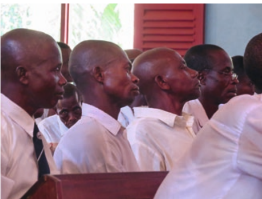
4. Enkele deelnemers aan de conferentie ingespannen luisterend - veel aandacht, grote betrokkenheid en goede vragen