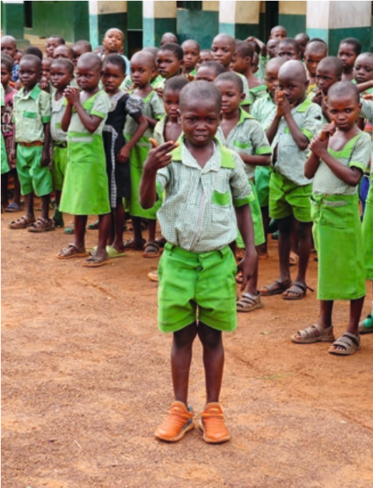
3. Dit leuke dove jongetje was bepaald niet verlegen - hij liet ons zien hoe je kunt tellen in gebarentaal