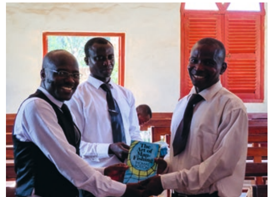
9. Enkele "vissers der mensen" - aan de linkerkant een predikant die juist is afgestudeerd in Grand Rapids (VS)