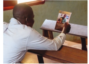
7. Een boekje over alcoholmisbruik trekt de aandacht - helaas is dit onderwerp in Nigeria blijvend actueel