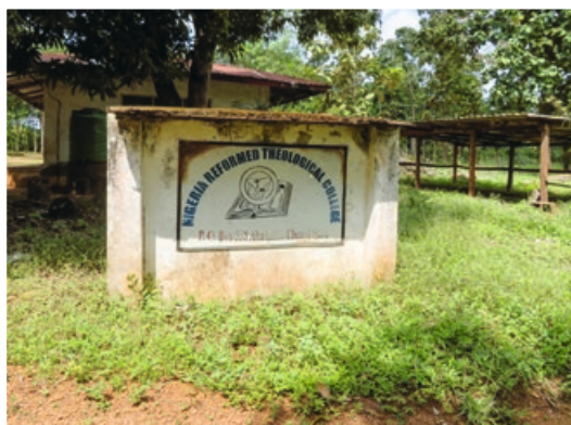
2. Op deze zuil is ook het logo van de Nigeria Reformed Church te zien - een kruis dat geplant is in het hart van Nigeria