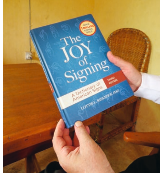
4. Een Amerikaans boek over gebarentaal - want, uiteraard, dat helpt om te communiceren met elkaar, ook in Nigeria