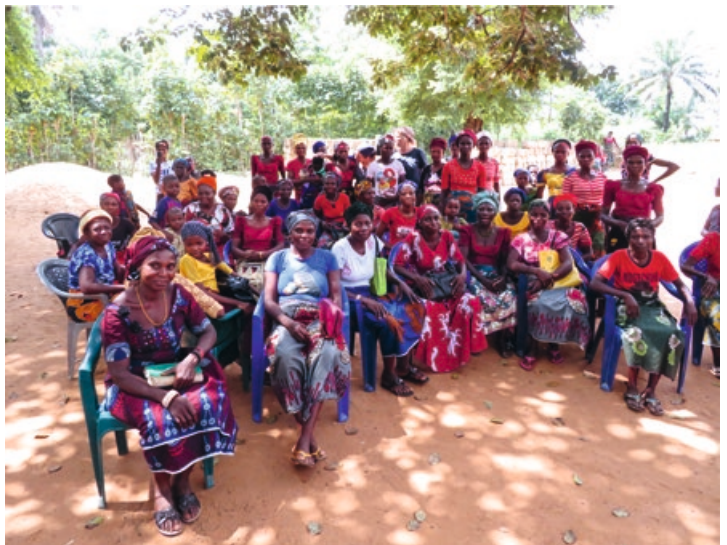
5. Een vrouwenvereniging van nabij genomen - wat hebben vrouwen een belangrijke taak voor hun gezin en de kerk!