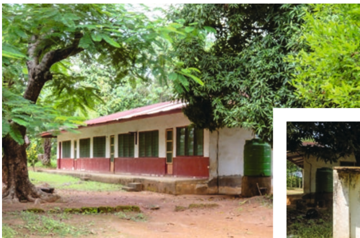
1. De voormalige Bijbelschool op de zendingspost van de GG - thans de opleiding voor a.s. predikanten en evangelisten