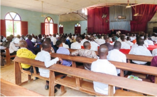
1. Overzicht van de conferentie - ca. 200 predikanten, ouderlingen, diakenen, evangelisten en andere kerkenwerkers