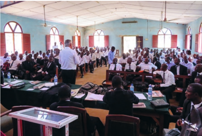
3. In drie dagen mochten acht Bijbelstudies gegeven worden over Efeze 6:10-20 - thema: "de geestelijke wapenrusting"