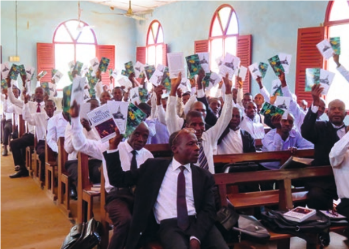
6. Mocht u denken dat de boeken en brochures niet worden gewaardeerd - kijk dan even naar deze gezichten!