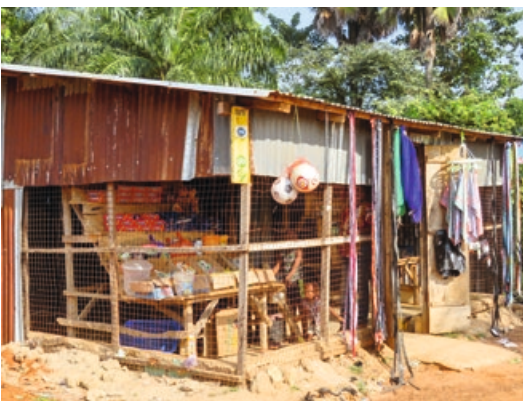
7. Op de brokstukken van de markt verrijzen alweer nieuwe winkeltjes - mede dankzij u en Bijzondere Noden