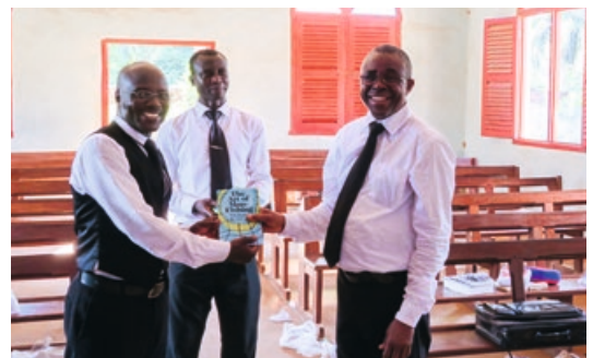
9. Een lijst met 49 van de 65 evangelisten - elk van hen kreeg in november een Engelse studiebijbel (KJV)