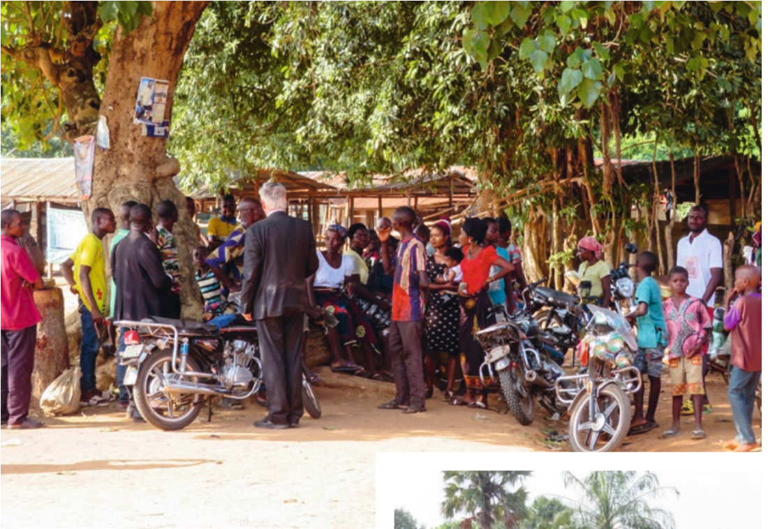
5. Ontmoeting met de plaatselijke bevolking (let op de angst in hun ogen) - de God aller genade gedenke hen!