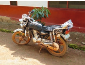
4. De motor waarmee de leidster de plaatselijke verenigingen gaat bezoeken, geschonken door de vrouwen van Alblasserdam